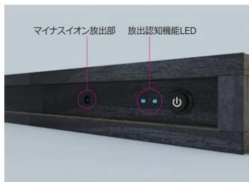
【マイナスイオン放出部及び放出認知機能LED】