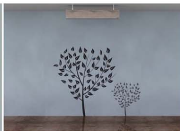
【天井に吊り下げて使用】