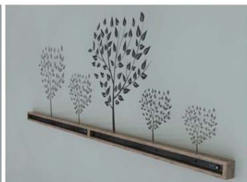
【壁に嵌めるように施工して使用】