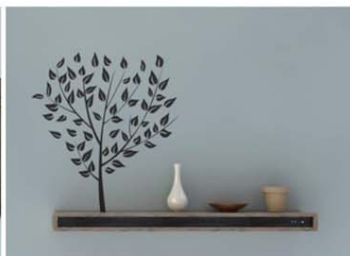
【壁にかけてインテリア棚のように使用】